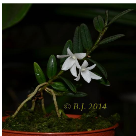
Angcm.pectinatum (O-Madagaskar) erwachsen im 5,5 cm Topf