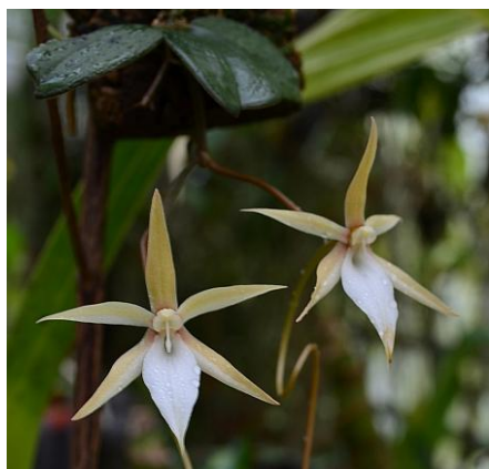
Aergs.monantha (Madagaskar, T, halbschattig)