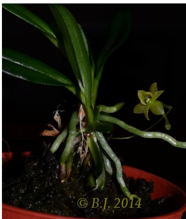
Angraecum ochraceum , Mini, O-Madagaskar