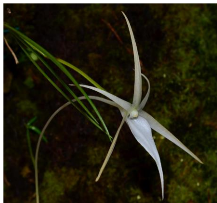
Angraecum teretifolium Madagaskar