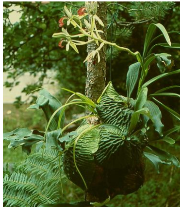
Platyserium madagascariense mit Cymbidiella pardalina