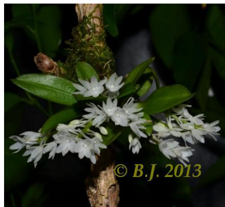
Aerangis hyaloides Madagaskar