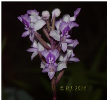
Cynorkis ridleyi (Madagaskar)