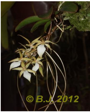
Aerangis fuscata (Madagaskar)