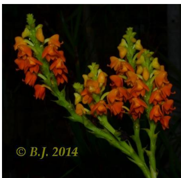
Polystachya clareae Madag.