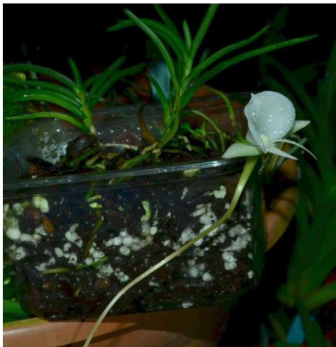
Angraecum pseudofilicornu (Madagaskar)