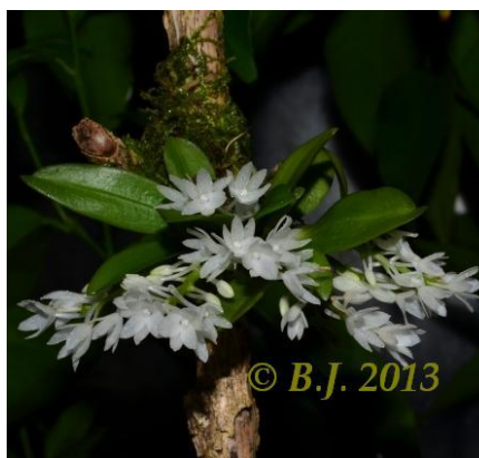
Aerangis hyaloides Madagaskar