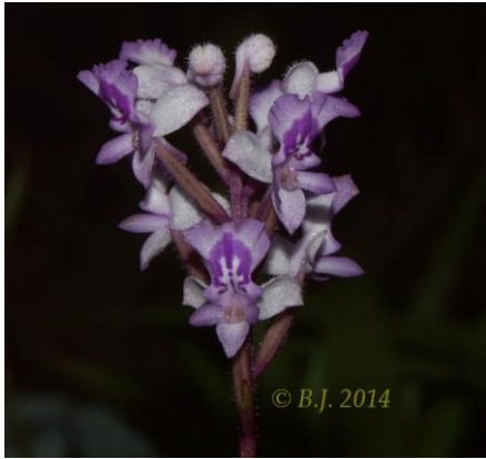
Cynorkis ridleyi (Madagaskar)