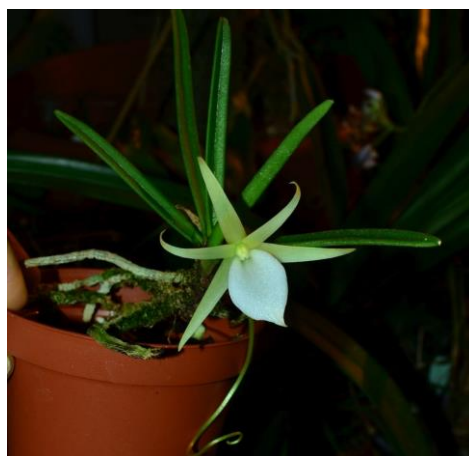
Angraecum peyrotii Madagaskar