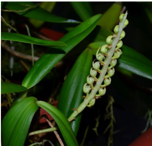
Bulb.scaberulum var. album