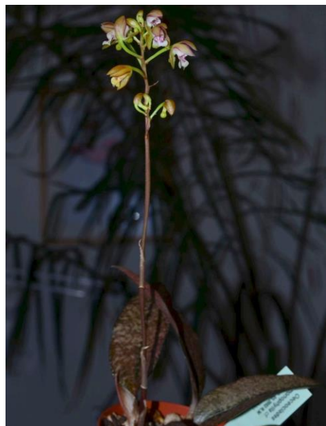
Oeceoclades monophylla (Madagaskar)