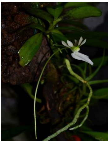
Neobathiea grandidieri (Madagaskar)