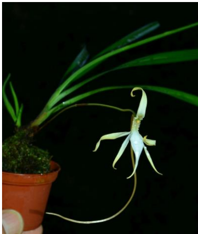
Jumellea gracilipes , Madagaskar